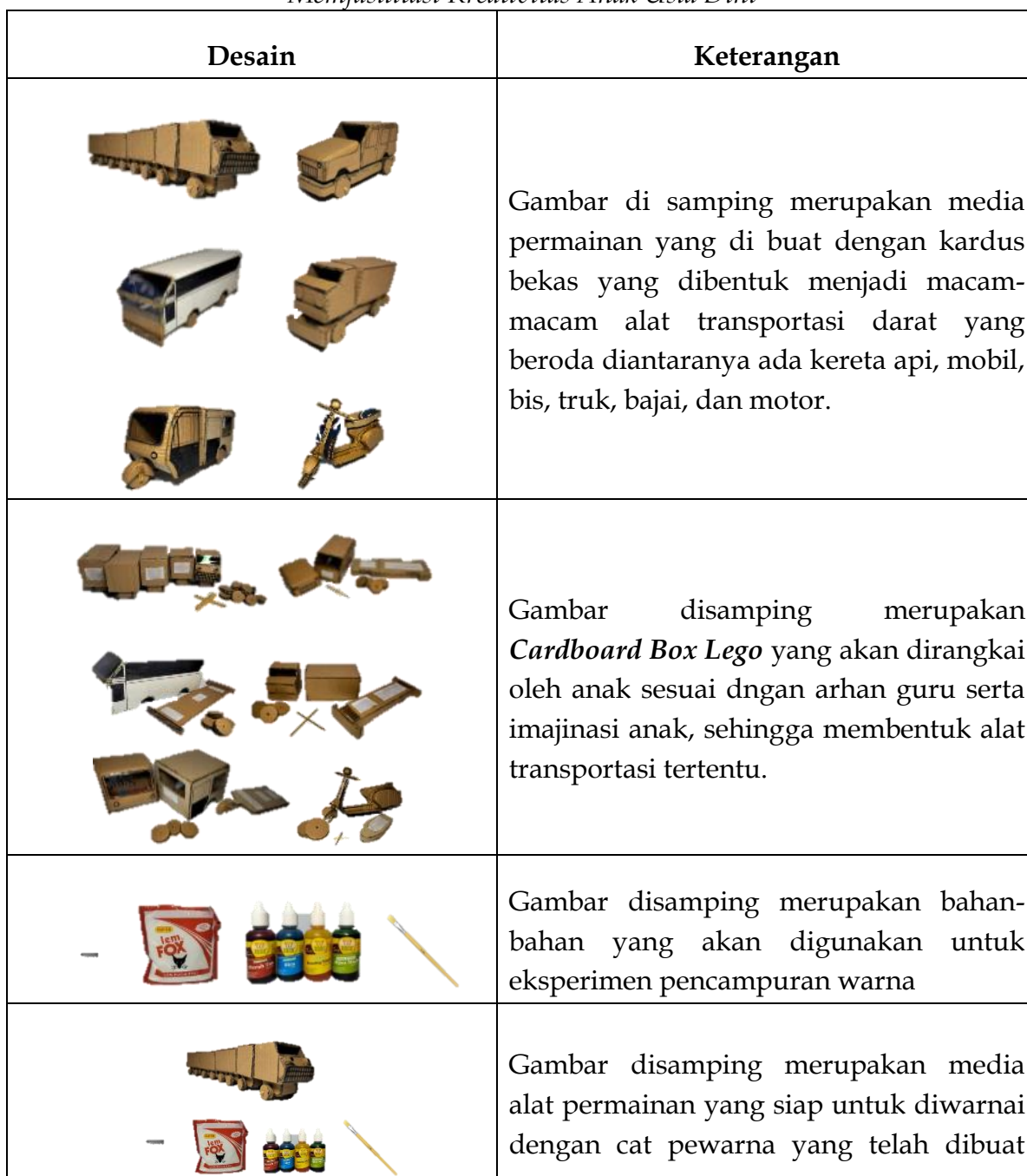
Tabel 4.1 Rancangan Media Permainan Sains Problem Solving Cardboard Box Lego untuk Memfasilitasi Kreativitas Anak Usia Dini

adalah Cardboard Box Lego yang membantu anak untuk menemukan yaitu konsep model alat transportasi darat (mobil, motor, truk, bis, bajai, kereta api). Aspek perkembangan kognitif ini dalam menumbuhkan kreativitas anak yang difasilitasi oleh media permainan sains bagi anak ini secara spesifik yaitu mengamati, mengklasifikasi dan mengkomunikasikan. Berikut merupakan rancangan media permainan sains problem solving Cardboard Box Lego yang dikembangkan oleh peneliti: